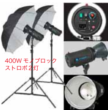
400W モノブロックストロボ2灯